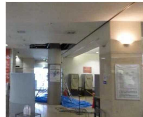
病院における天井の損傷